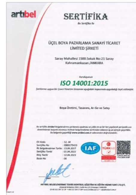
ISO 14001-2015 2023