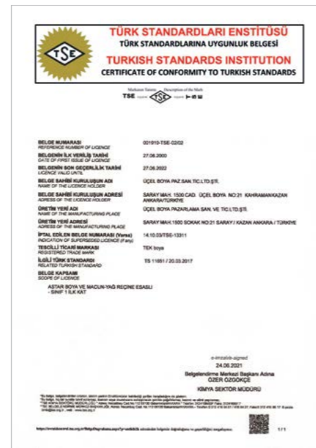
TSE (Astar Boyalar)