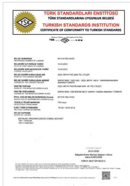
TSE (Saten ve Yağlı Boyalar)