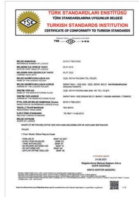
TSE (Su Bazlı Dış Cephe Boyaları)