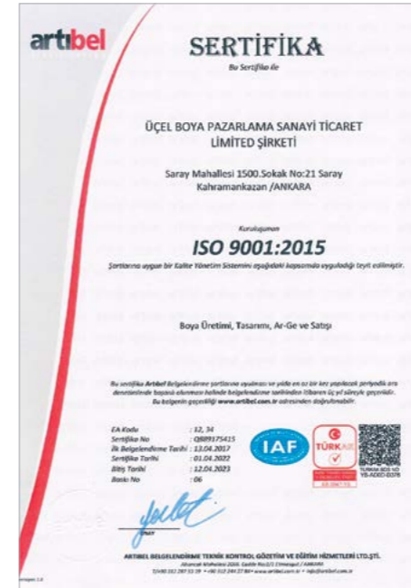
ISO 9001-2015 2023