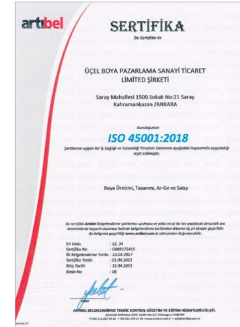
ISO 45001-2018 2023