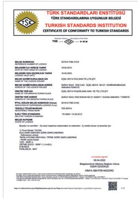
TSE (Su Bazlı İç Cephe Boyaları)

Belgelerimizin tamamını ve ayrıntılarını tekboya.com adresinde bulabilirsiniz.